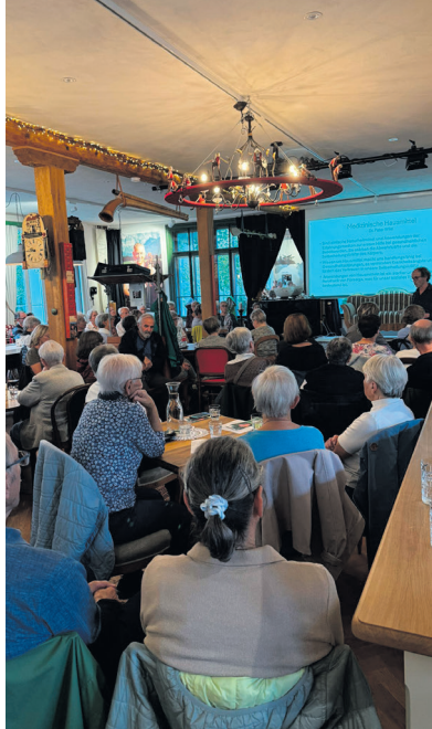
Abendgespräch im Kafi KARL