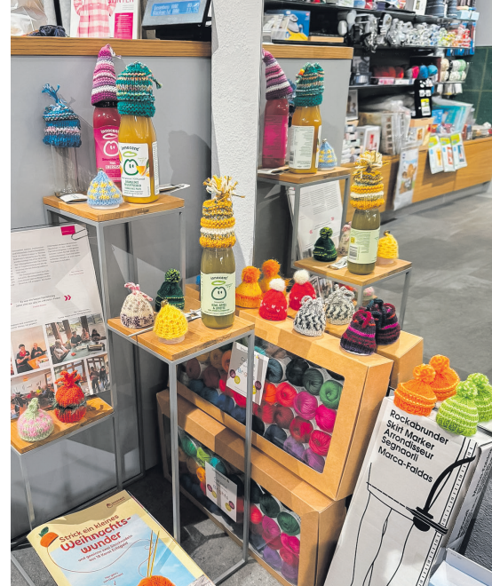
Mach dich müzzlich